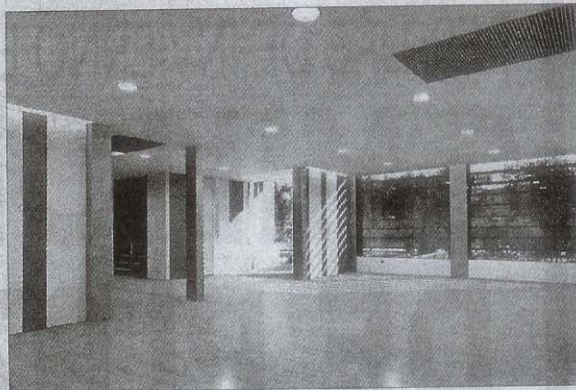
► Entrada interior del hotel, aún sin amueblar.